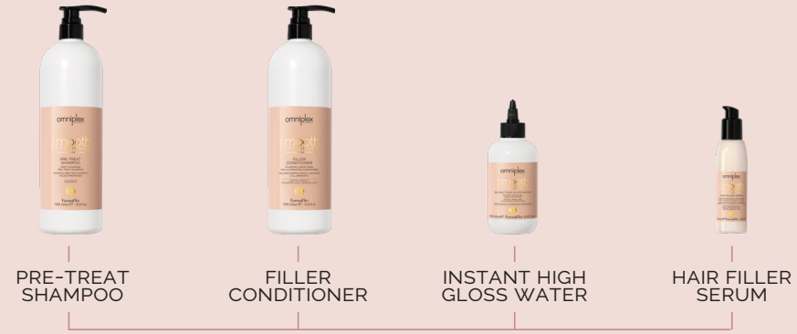
PRE-TREAT SHAMPOO FILLER CONDITIONER INSTANT HIGH GLOSS WATER HAIR FILLER SERUM