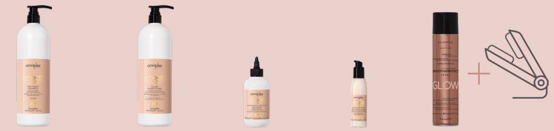
PRE-TREAT SHAMPOO FILLER CONDITIONER INSTANT HIGH GLOSS WATER HAIR FILLER SERUM HD SMOOTH AND PROTECT