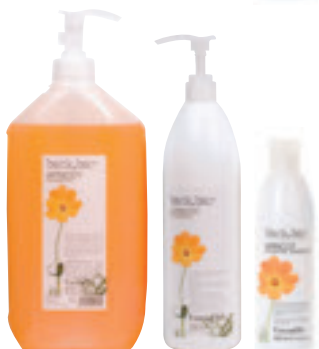
Apricot Shampoo <250 ml / 1000 ml / 5 l> I Shampoo nutritivo all'albicocca per capelli secchi e stressati, con trealosio. GB Nourishing apricot shampoo for dry and stressed hair, with trehalose.