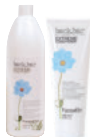
Extreme Conditioner <250 ml / 1000 ml> I Balsamo idratazione profonda per capelli secchi. GB Deep nourishing conditioner for dry hair, with precious silicones.