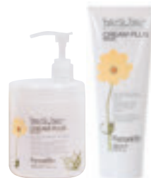
Cream Plus Mask <250 ml / 1000 ml> I Balsamo per capelli colorati-trattati, con estratto di semi di girasole. Aiuta a proteggere e prolungare la durata e la brillantezza del colore. GB Conditioner for colour-treated hair, with sunflower seed extract. Provides protection and shine and helps prevent colour fading.