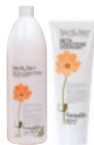
Beta-Carotene Conditioner <250 ml / 1000 ml> I Balsamo per tutti i tipi di capello, con Betacarotene, Vitamina A e Vitamina E. GB Conditioner for all hair types, with Betacarotene, Vitamins A and E.