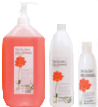
Red orange Shampoo <250 ml / 1000 ml / 5 l> I Shampoo all'arancia rossa con latte di mandorla dolce, per capelli colorati-trattati. GB Red orange shampoo with sweet almond milk, for colour-treated hair.