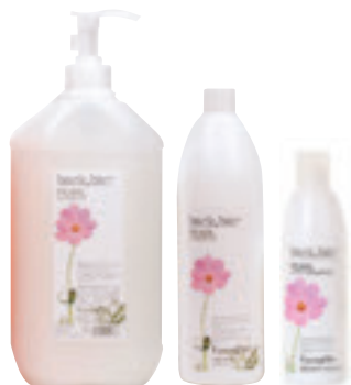
Pearl Shampoo <250 ml / 1000 ml / 5 l> I Shampoo per uso frequente, pH 5.5. GB Daily use shampoo, pH 5.5.