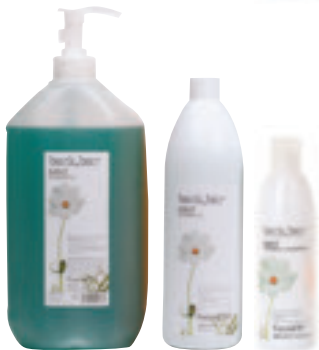
Mint Shampoo <250 ml / 1000 ml / 5 l> I Shampoo alla menta per uso frequente. GB Mint shampoo for daily use.