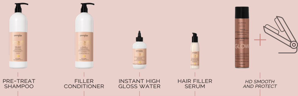
PRE-TREAT SHAMPOO FILLER CONDITIONER INSTANT HIGH GLOSS WATER HAIR FILLER SERUM HD SMOOTH AND PROTECT