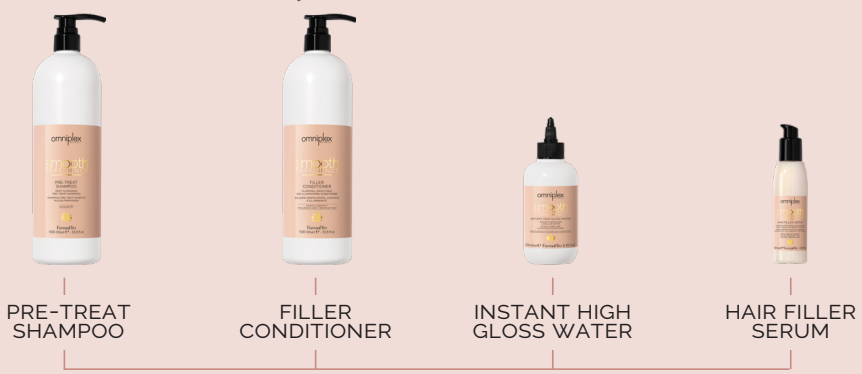
PRE-TREAT SHAMPOO FILLER CONDITIONER INSTANT HIGH GLOSS WATER HAIR FILLER SERUM