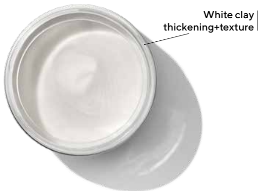
White clay | thickening+texture