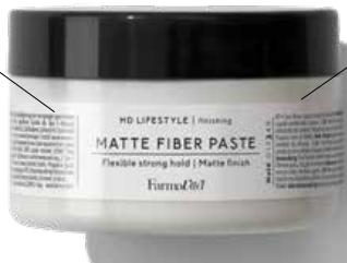
Flexibility and control